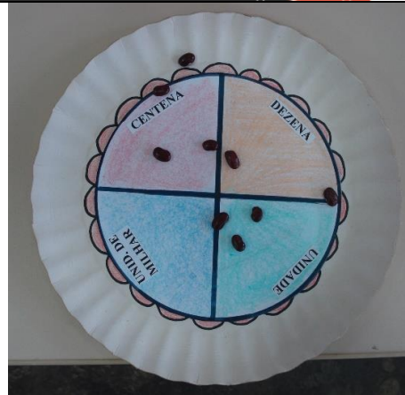
Figura 2 – Jogo dos Pratos

Atividade 7 – Trabalhando língua portuguesa com música; Foi trabalhado a música de Vinicius de Moraes, “o pato pateta” para auxiliar na aprendizagem da língua portuguesa e incentivar a leitura, após foi realizado uma confecção do pato referente a música, com folha de cartolina.