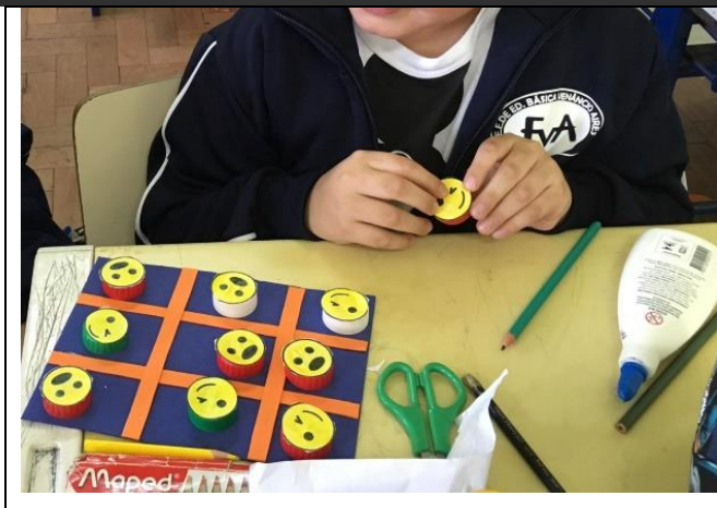
Figura 1 – Jogo da Velha