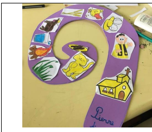
Figura 3 – Caracol da Parlenda

Atividade 8– Sarau de Parlandas - “cadê o toucinho que estava aqui”, “o doce mais doce”, “a casinha da vovó”, “a pedrinha”, para auxiliar na alfabetização e no aspecto da forma da linguagem, componente sonoro. E confecção em EVA em caracol com as imagens da parlenda “cadê o toucinho que estava aqui” (FIGURA 3). “A barata diz que tem” confecção com cd. (FIGURA 4). Após estas atividades foi realizado o sarau de parlandas, para esta atividade uma turma apresentou e a outra foi convidada para assistir. Foram apresentadas as quatro canções esta atividade teve como propósito desenvolver a escrita e oralidade.